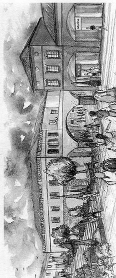
Voilà à quoi devrait ressembler le futur village de marques "Moulin de Nailloux". Les travaux de terrassements vont commencer d'ici à quelques semaines. Ouverture prévue début 2010.

35 000 m 2 de bâtiments dont 22.505 m 2 de surface de vente ; 125 boutiques ; 1809 places de parking pour motos, voitures, camping-cars et autobus ; 4 cafés et restaurants, 2 aires de jeux pour enfants... Les chiffres ont de quoi donner le vertige ! Validé par la Commission départementale d'équipement commercial de haute-Garonne en décembre dernier, tirant par ailleurs profit de l'échec du projet de Saverdun (on n'imagine pas deux villages de marque à 15 km de distance...), le projet de village de marques "Moulin de Nailloux" est sur de très bons rails, avec pour le guider le PDG de la société Advantail Franck Verschelle : "Ce genre de projet, c'est notre métier, confie-t-il, nous sommes opérateurs