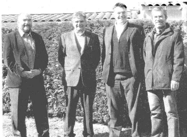
Les élus et le président de la Cogep.

C'est ainsi que le plus grand village des marques du sud de la France verra le jour fin 2009 pour la première tranche. Le travail de terrassement débutera début avril 2008 pour un début de travaux fin 2008. La commercialisation des lots se fera à partir de mai 2008.